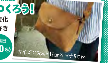
サイズ: 17cm x 15cm x マチ5cm