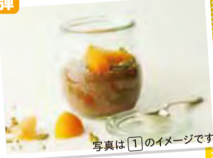
写真は①のイメージです。

時間 18:00~19:30 (第1弾 共通) 開講日 1 8/28 (日) アボカドとオレンジのチョコレートムース 2 9/25 (日) ひんやりさっぱり！ブルーベリーのローケーキ 3 10/23 (日) 上品な和スイーツ！豆腐と抹茶のパバロア 受講料 各回 受講料 ¥2,000 材料費 ¥1,000 合計 ¥3,000