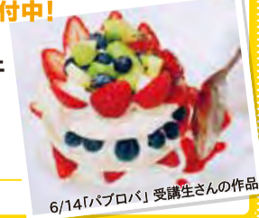
6/14「パバロア」受講生さんの作品

開講日 7/12 (日) 爽やか&涼やか！柑橘とヨーグルトのクリームパフェ 7/26 (日) 出た！スーパーフードアアシード！南国風濃厚マンゴプリン 受講料 各回 受講料 ¥2,000 合計 ¥3,000 材料費 ¥1,000