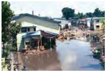
寺沢川のはん濫で浸水被害を受けた住家