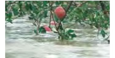
台風による大雨で、収穫前のりんごが水に浸かった(2013年9月)

Check 河川情報はこれでチェック! http://www.kasensabo.bousai.pref.aomori.jp