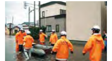
高杉地区で大鉢川がはん濫し、避難できない住民をボートで救助に向かう消防隊員(2013年9月)

はん濫の恐れがあるとき「〇〇川はん濫注意情報」のように発表されます。発表されたら、河川の近くにお住まいの方は避難の準備をしましょう。