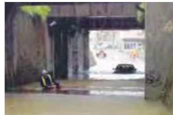
大雨で冠水する和徳(わとく)ガード下