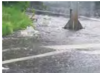
激しい雨で排水が追いつかず、道路が冠水した樹木地区