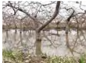
りんごの木や枝が水に浸かった三世寺地区の園地